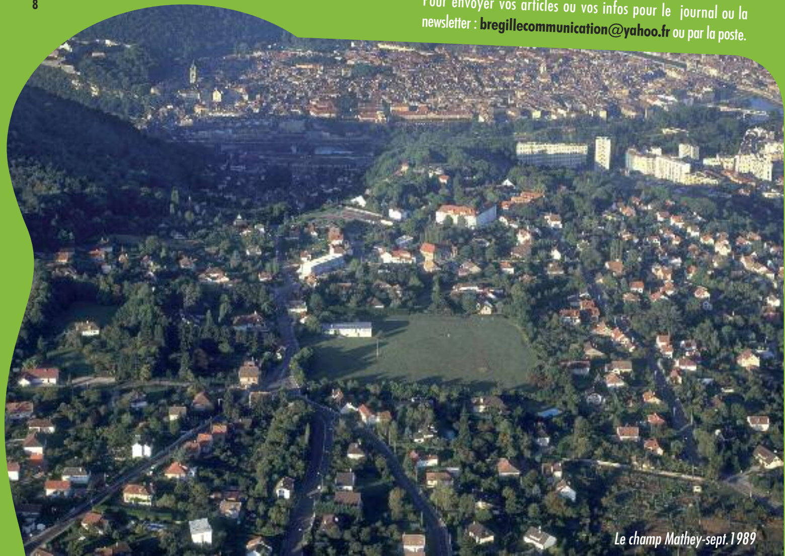
Le champ Mathey-sept. 1989