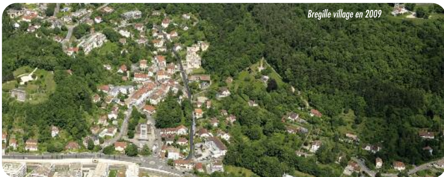
Bregille village en 2009

site: http://lamaisondequartierdebregille.fr