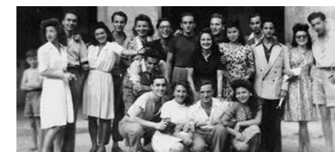
Août 1943, Réfugiés et Saint Martinois devant la mairie de Saint-Martin-Vésubie