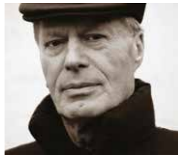
J. M. G. Le Clézio