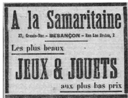
Le petit Comtois du 15 décembre 1920