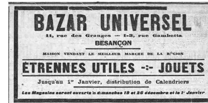
Le petit Comtois du 19 décembre 1920

modestes. Et cette date correspondait souvent au vrai jour des cadeaux. B. J.