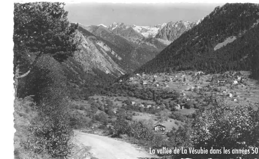
La vallée de La Vésubie dans les années 50