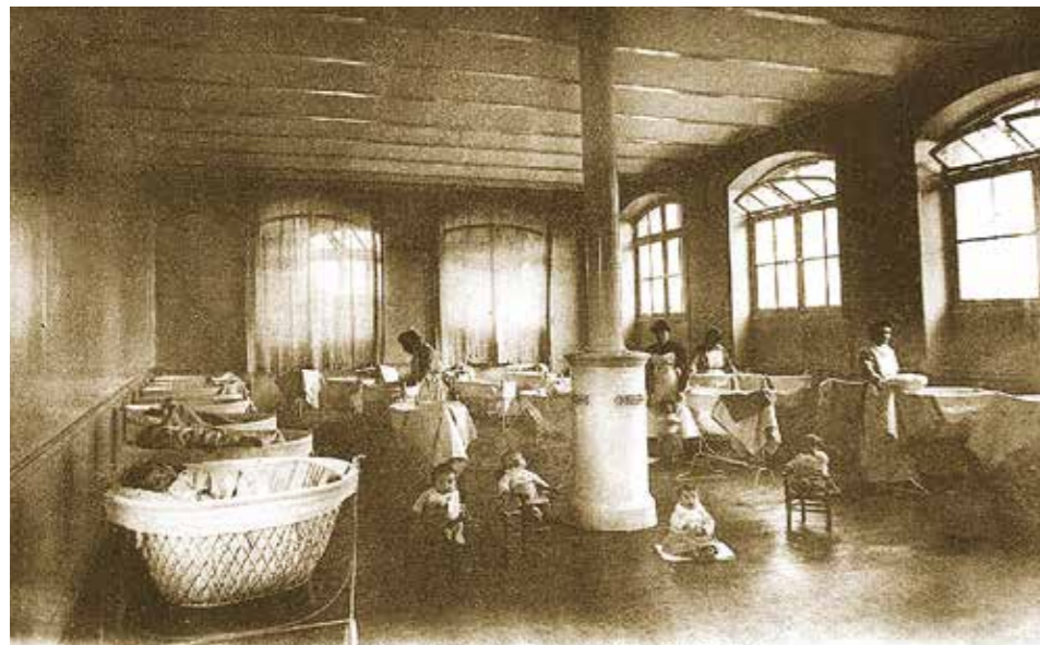
BESANÇON. - Crèche Bersot - "Allons faire do-do."

Dans le même journal, mais celui du 24 décembre 1930, c'est le Noël au Lycée Pasteur que retient un chroniqueur. Il signale cette fête comme « une habitude depuis quelques années ». Pour le Noël 1930, trois jours de suite l'établissement reçut des enfants. D'abord « les classes primaires de moins de six ans » qui chantèrent et mimèrent avant que le Père Noël ne distribua « des jouets à chacun » ; puis les tout petits et enfin, au troisième jour, les plus grandes « pas moins curieuses de leur surprise que les moins de quatre ans ».