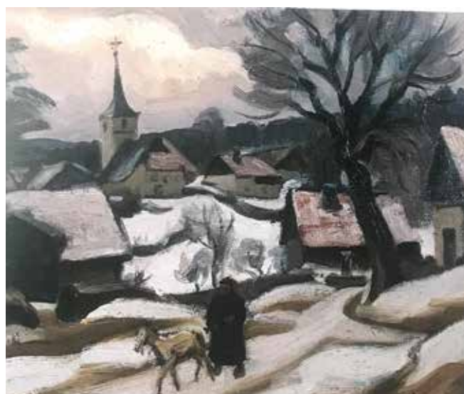
Tableau de haut en bas : 1-Neige près de Morteau 2-Village du Haut-Doubs 3-Chasseur en hiver