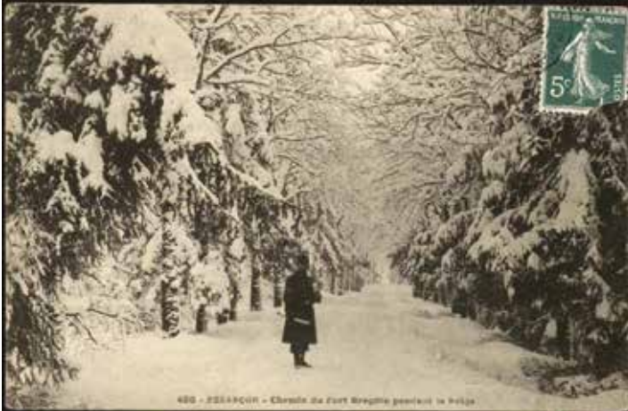
Chemin du Fort de Bregille pendant la Neige

Il y a quelques temps, un ancien du quartier de Bregille, né à Bregille-Village, m'apprenait que 1961 était la dernière année où il avait pu descendre en luge les rues de la colline. Il l'avait fait du chemin des Verjoulots jusqu'au bas du chemin du Fort. Il y eut encore des périodes d'enneigement après cette date, la blancheur hivernale ne se fait rare que depuis les années 1990, mais la circulation automobile devenue plus intense a interdit de se risquer en luge sur ces rues.