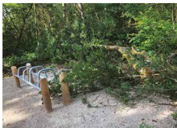
Les nouveaux agrès ont miraculeusement échappé au pire lors de la dernière tempête !

Périodique gratuit tiré à 2 000 exemplaires